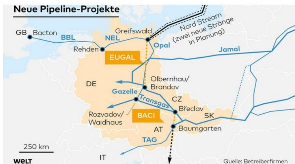
Ryc. 3. Projekt Nord Stream II – gazociąg EUGAL.

źródło: W. Jakóbiak, A. Kucharska, P. Stępiński, EUGAL: Niemcy mają sposób na ominięcie prawa unijnego przez Nord Stream 2 , http://biznesalert.pl/eugal-niemcy-maja-sposob-na-ominięcie-prawa-unijnego-przez-nord-stream-2/ , [dostęp: 18.16.2016 r.].